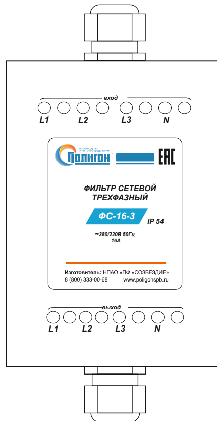
Рис.1. Порядок подключения фильтра ФС-16-3 IP54.