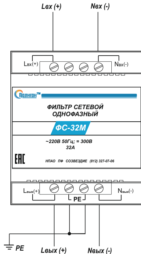
Рис.1. Порядок подключения фильтра ФС-32М.